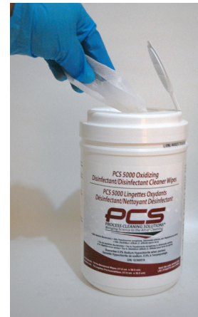
Thread wipe through lid and snap lid back onto container.