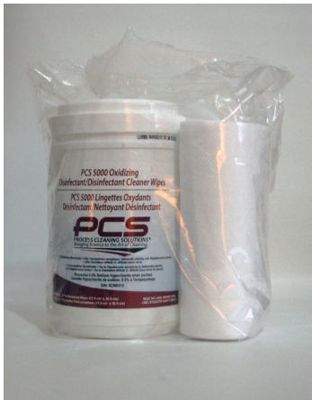
To make pre-moistened wipes. Remove container and dry wipes from plastic pouch.