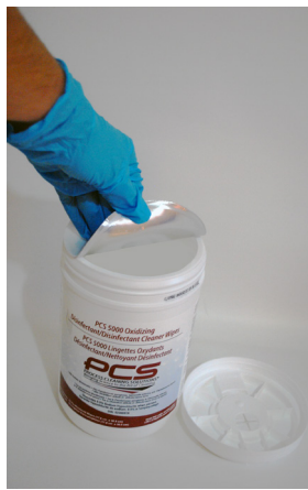
Place container on a flat surface and secure with one hand. Pry top of container towards you with the other hand to remove. OR Place container on a flat surface and secure with two hands. Push upwards with both thumbs to remove the top from the container. Once open peel the protective seal off slowly.