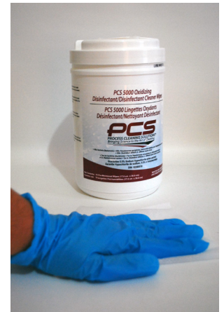
Dispense wipe from container, use to clean and disinfect surfaces. Discard in trash.