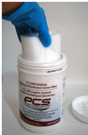
Slowly place roll of dry wipes into container.